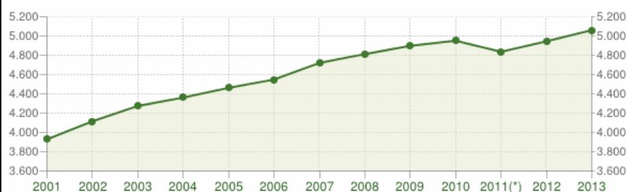
Andamento della popolazione residente

(2.481 maschi e 2.528 femmine), con una densità abitativa di 88,5 ab/kmq. L'età media della popolazione è di 42,8 anni, gli stranieri presenti sono il 5,8% del totale.